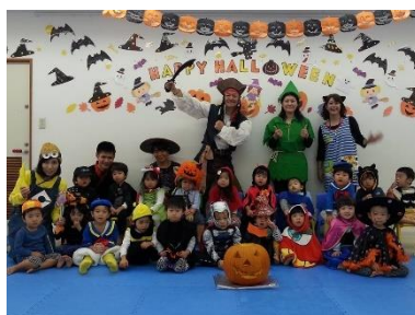
ハロウィン仮装行列