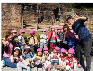
園外保育(多摩動物園)