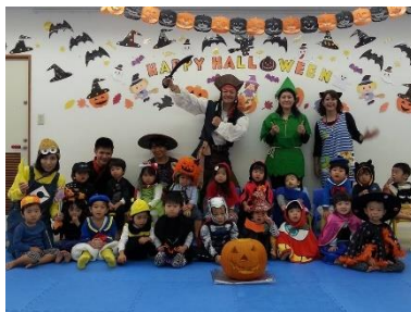
ハロウィン仮装行列