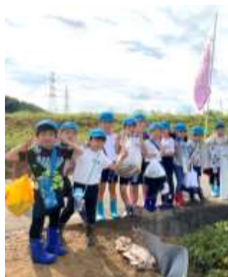
園外保育（お芋掘り）