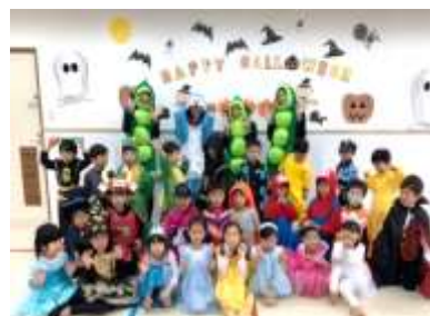
ハロウィン仮装行列